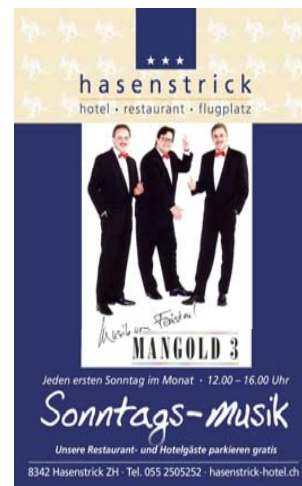
Für gute Stimmung ist gesorgt