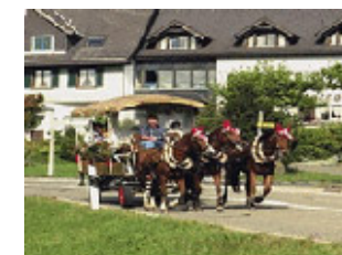
Reiten und Kutschenfahrten