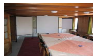
Besprechungs- und Seminarraum

Amexco - Diners - Visa - Master - PostCard - Maestro LunchCheck - REKA - WIR