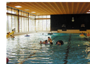
Hallenbad in Wald

Viele weitere Freizeitangebote: Eislaufen, Trainingswochen, Privat und Gruppen, Hotel-Eislauftrainerin. Frühjahrs- und Herbsttreffen für Oldtimer, Classic Cars, alte Motorräder, alte Traktoren + alte Flugzeuge. Motor- + Gleitschirmfliegen, Minigolf, Tennis, Golf, Höhenwanderung, etc. Alpamare, Kinderzoo, Rodelbahn. Museen + Ausstellungen, Ausflüge.