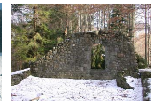
Ruine Bernegg bei Girenbad