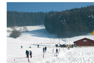
Aktivitäten im Schnee