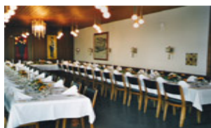
Grosser Saal für Anlässe