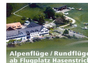
Alpenflüge / Rundflüge ab Flugplatz Hasenstrick